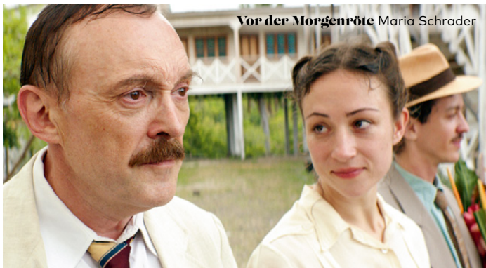
Vor der Morgenröte Maria Schrader