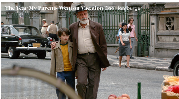
The Year My Parents Went on Vacation Cao Hamburger